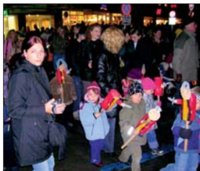
Groß und Klein war begeistert vom Laternenumzug in der Rosengasse.

Der erste Bauabschnitt in der Rosengasse wurde im Frühjahr 2004 begonnen und bis zum Sommer d.J. fertiggestellt.