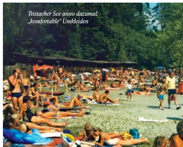
Tristacher See anno dazumal: „komfortable“ Umkleiden